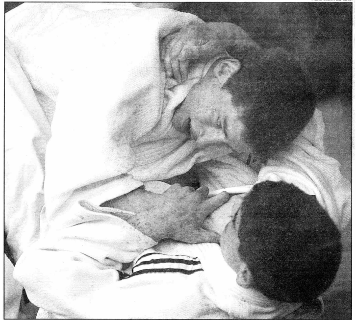
Les combats ont été comme toujours très disputés.

prix d'excellence avec le fameux Label A. Ce week-end, il s'agissait juste d'un incident de parcours face auquel le club était confronté malgré lui. Mais cette indisposition a eu un côté positif. Il a permis aux judokas, jus-